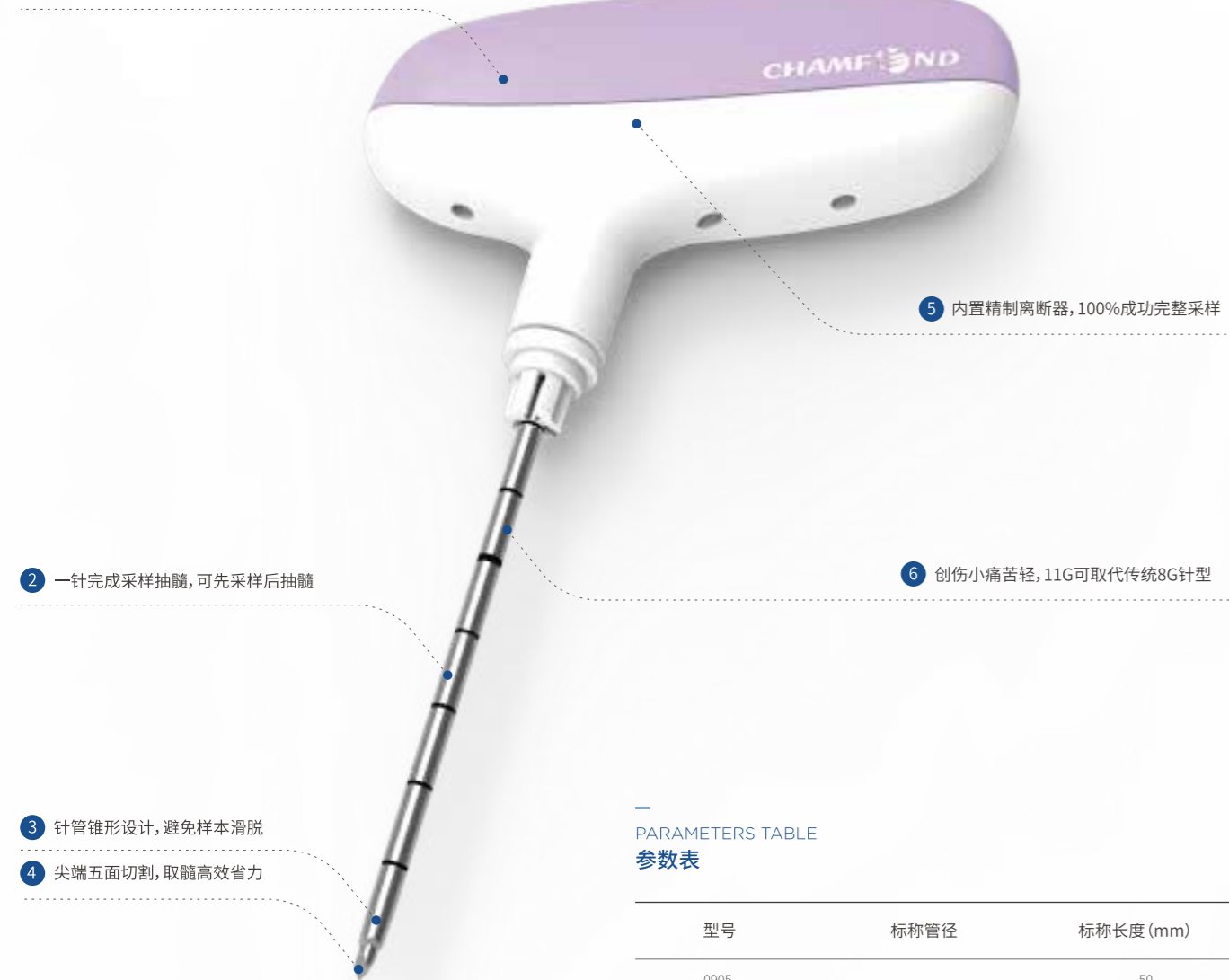
PARAMETERS TABLE 参数表